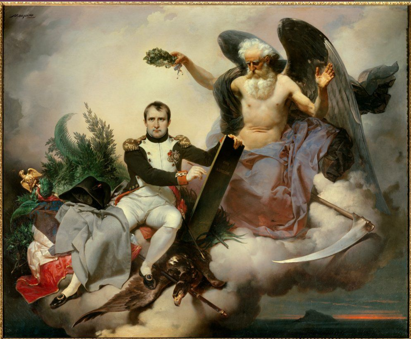
“Napoleão I, coroado pela Alegoria do Tempo, redige o Código Civil”, Jean Baptiste Mauzaisse, 1833