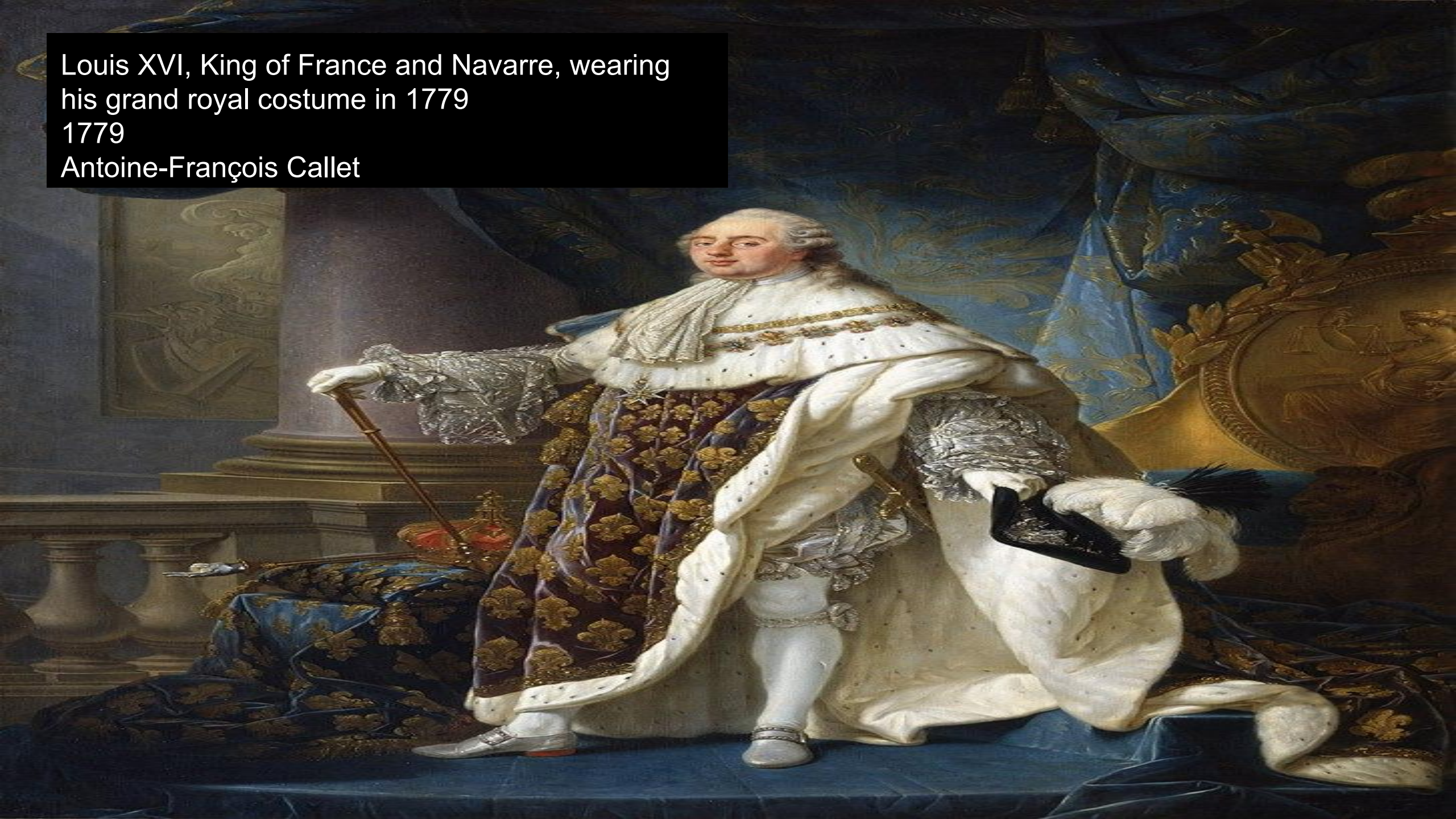
Louis XVI, King of France and Navarre, wearing his grand royal costume in 1779 1779 Antoine-François Callet