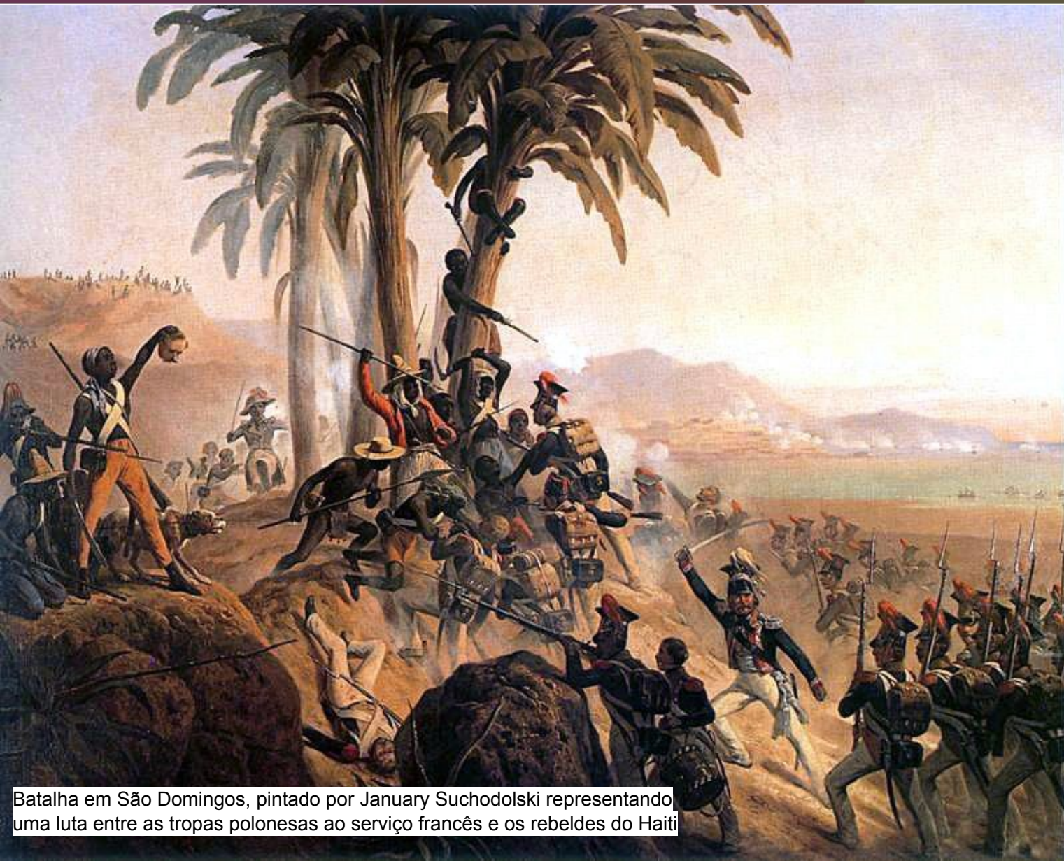
Batalha em São Domingos, pintado por January Suchodolski representando uma luta entre as tropas polonesas ao serviço francês e os rebeldes do Haiti