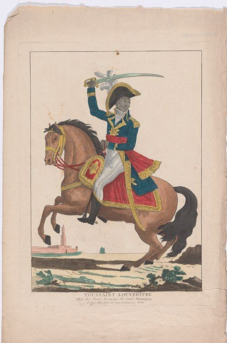
Louverture conforme retratado em uma gravura francesa de 1802