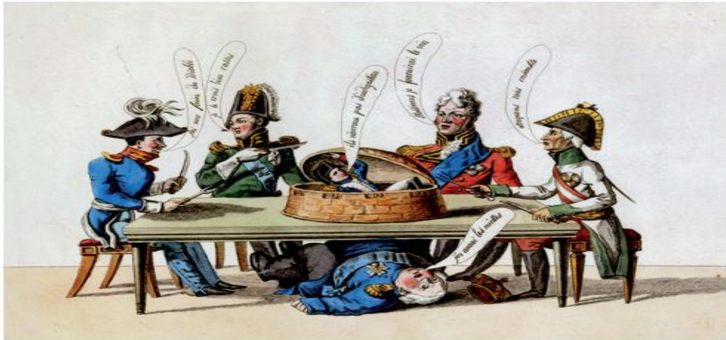
Anônimo – O Patê Indigesto – século XIX. In: ENDERS, Amelle; MORAES, Marieta; e FRANCO, Renato. História em Curso: da Antiguidade à Globalização . São Paulo: Editora do Brasil; Rio de Janeiro: Fundação Getúlio Vargas, 2008, p. 227.