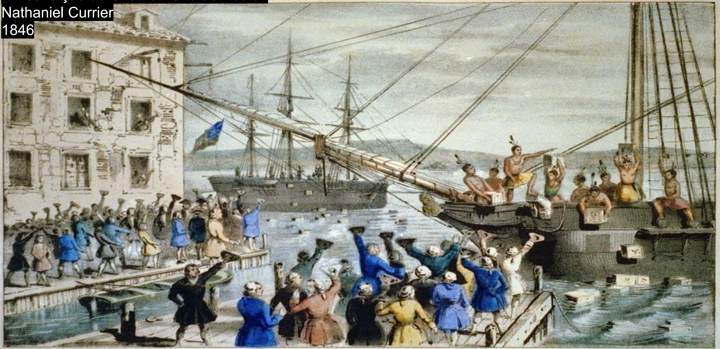
THE DESTRUCTION OF TEA AT BOSTON HARBOR.