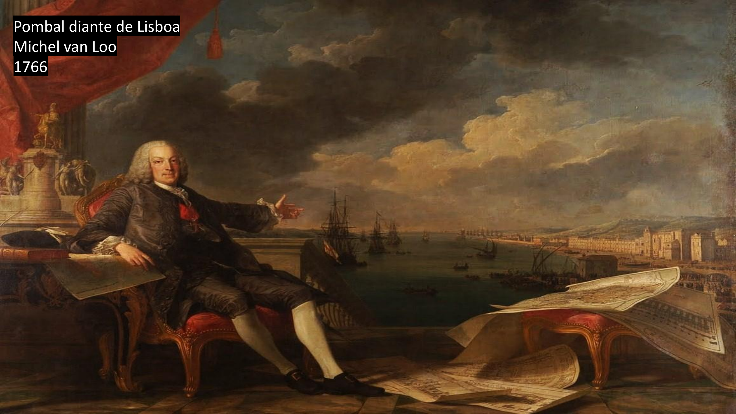
Pombal diante de Lisboa Michel van Loo 1766