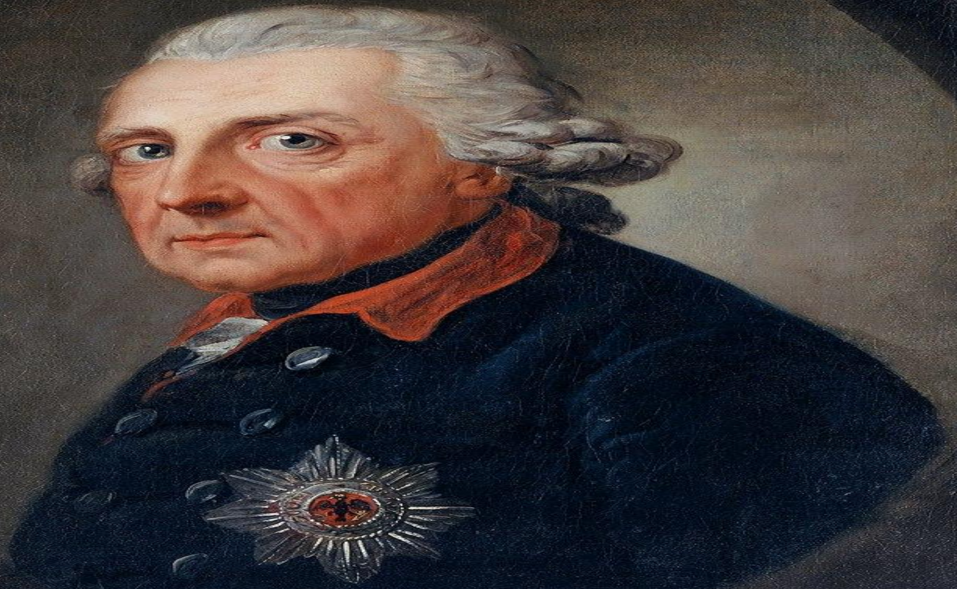
Frederico o Grande Anton Graff c. 1781-1786